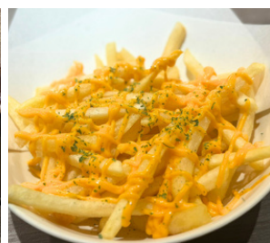
チーズポテトフライ