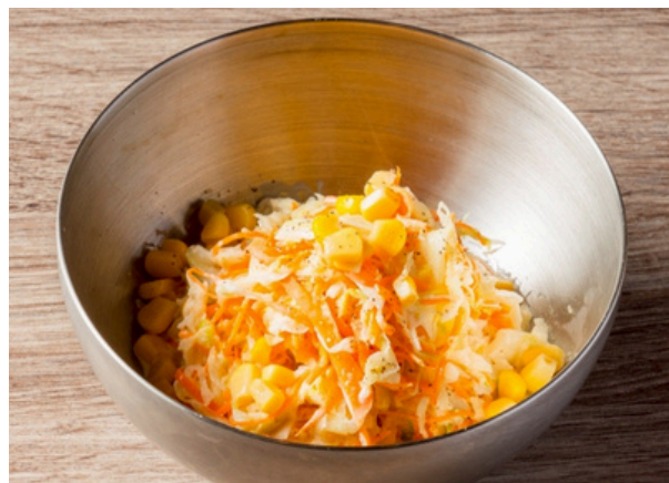
コールスローサラダ