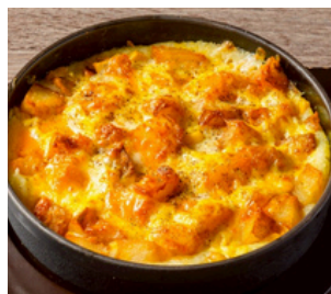
マッシュポテトグラタン