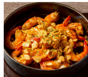
ガーリックシュリンプ