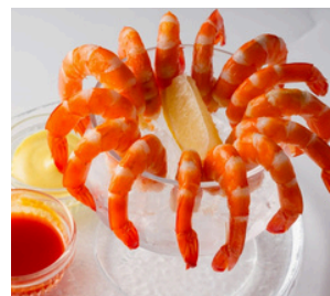
シュリンプカクテル