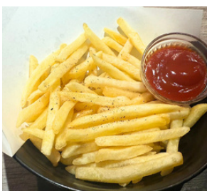
トリュフポテトフライ