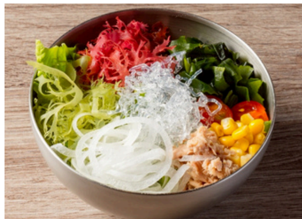
シーフードサラダ